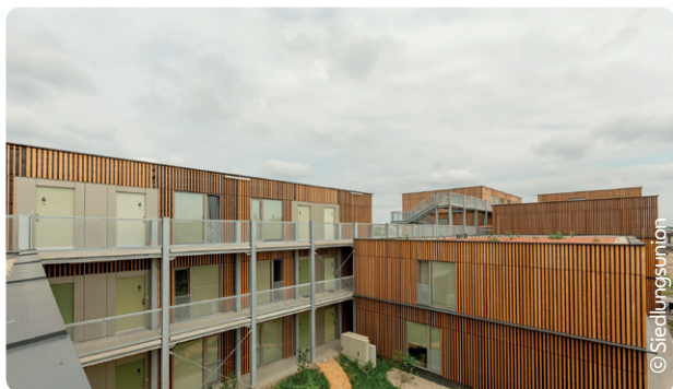
Erschließungssystem im Innenhof

Die Wohnanlage in der Podhagskygasse ist eines der Pionierprojekte des von der Stadt Wien 2016 gestarteten Sofortwohnbauprogramms. Für dieses Programm wurde eine neue Förderschiene eingerichtet. Die Grundidee ist dabei, kostengünstigen Wohnraum auf derzeit nicht gewidmeten oder mit Bausperre belegten Grundstücken zu fördern. Das Besondere daran ist, dass die Bauten „nur“ temporär errichtet werden und nach einer vorgegebenen Laufzeit (in der Podhagskygasse nach 10 Jahren) demontiert werden müssen, jedoch an einem anderem Ort wiedererrichtet werden können. Das Grundstück in der Podhagskygasse hat sich aufgrund der derzeitigen Widmungsverhältnisse für eine derartige Wohnbebauung geeignet, somit konnte das Pilotprojekt zwischen 2017 und 2018 realisiert werden. Der Zeitraum zwischen Baubeginn und Erstbezug lag – unter Berücksichtigung der gängigen Qualitätsstandards – bei nur 9 Monaten. Durch entsprechende Förderungen kann somit in kürzester Zeit leistbarer Wohnraum zur Verfügung gestellt werden. Das Projekt läutet damit eine neue Ära im Wohnbau ein, wenn es um kostengünstigen, schnell und temporär verfügbaren Wohnraum geht.